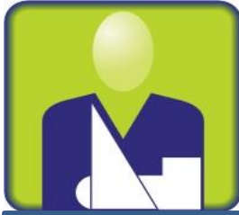
INVALIDEZ TRANSITORIA PARCIAL