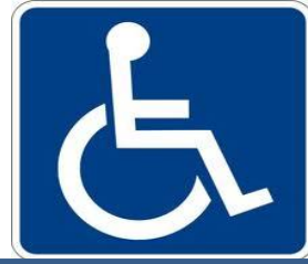
INVALIDEZ DEFINITIVA TOTAL