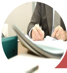
Ingreso de Solicitud en A.F.P.